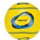
Avento Mini Voetbal - Elipse-2 Geel/Blauw/Antraciet - 2

We hebben hiervoor gekozen, zodat de veiligheid op het plein tijdens het buitenspelen toeneemt. De laatste tijd namen kinderen regelmatig (voet)ballen mee van thuis, waardoor er allerlei ballen rondvlogen in de pauzes. Nu willen we dat reguleren en daarom heeft iedere groep dit → kleine balletje gekregen.